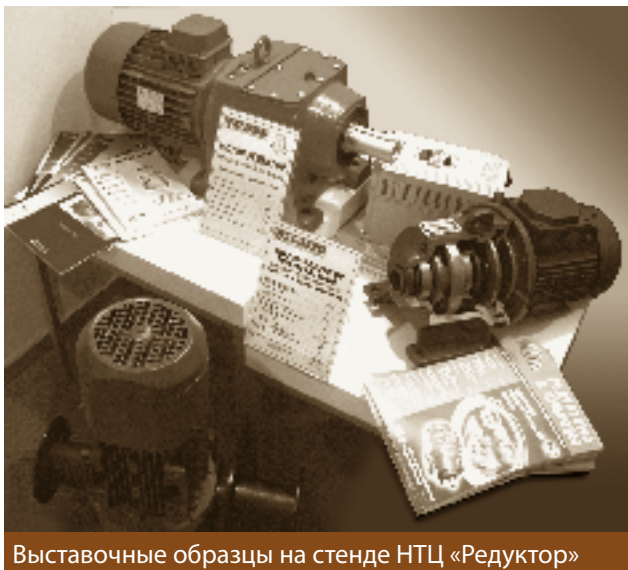
Выставочные образцы на стенде НТЦ «Редуктор»

НТЦ «Редуктор» – и по ценам, и по техническим характеристикам. Но самое главное то, что если при работе лебедок и возникнут проблемы – отремонтировать или заменить их будет значительно легче, нежели финские, ведь предприятие-производитель находится практически рядом.