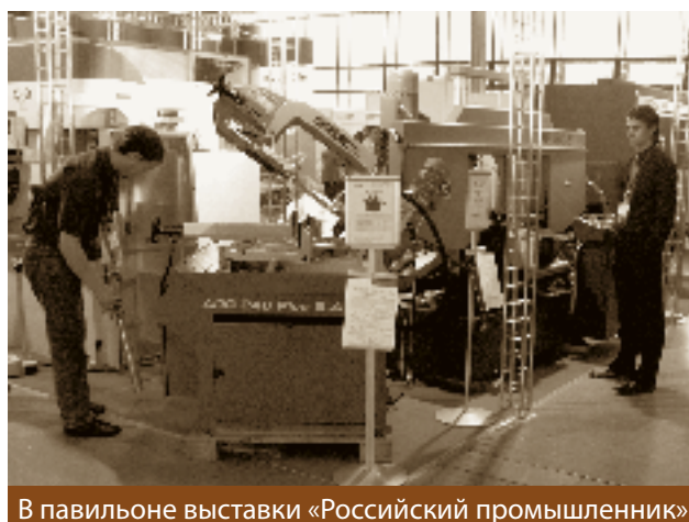
В павильоне выставки «Российский промышленник»

– На нашем предприятии установлены лебедки из Финляндии. Неплохие в работе, но и неплохая техника тоже порой выходит из строя. Пока из всего, что увидел на выставке в области производства подобного оборудования, более всего впечатлила продукция