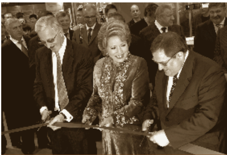
В.И. Матвиенко на торжественном открытии форума

Форум «Российский промышленник» помогает объединять усилия предприятий нашей страны в развитии отечественной индустрии, становлении конкурентоспособной промышленности. Он сближает зарубежных и российских производителей и способствует укреплению не только межрегиональных, но и международных экономических связей.